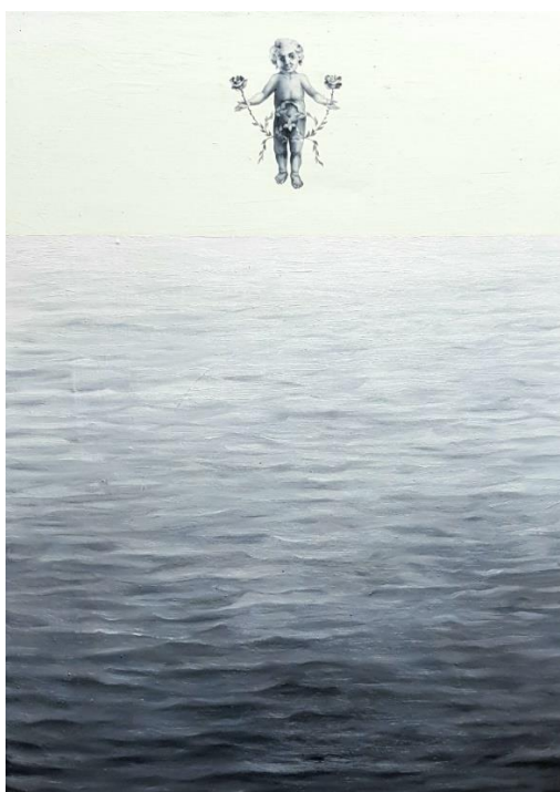
Robo Bielík, Ježiško nad morom, 1996, olej, plátno, 90 x 50 cm

Akvíziu z verejných zdrojov podporil Fond na podporu umenia. Fond na podporu umenia je hlavným partnerom projektu.