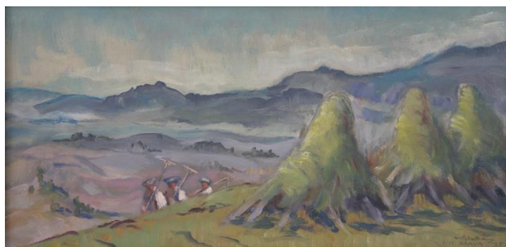
Martin Benka, Na sená - Orava, 1935, olej, kartón, 31 x 61 cm

Akvizíciu z verejných zdrojov podporil Fond na podporu umenia. Fond na podporu umenia je hlavným partnerom projektu.