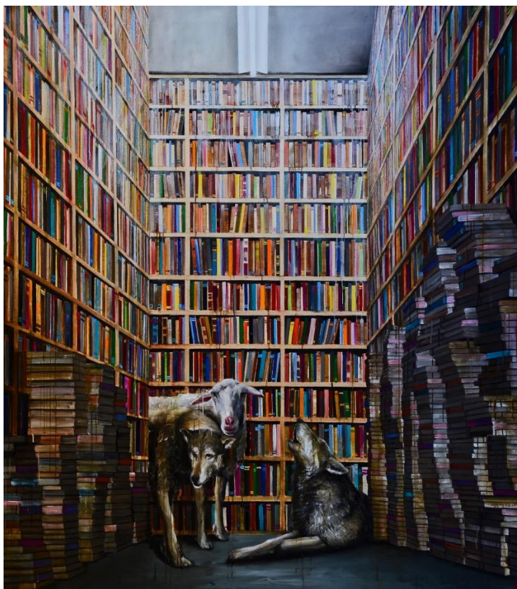
Robert Bielík, Knižnica, 2018, olej, plátno, 170 x 150 cm

Akvíziu z verejných zdrojov podporil Fond na podporu umenia. Fond na podporu umenia je hlavným partnerom projektu.