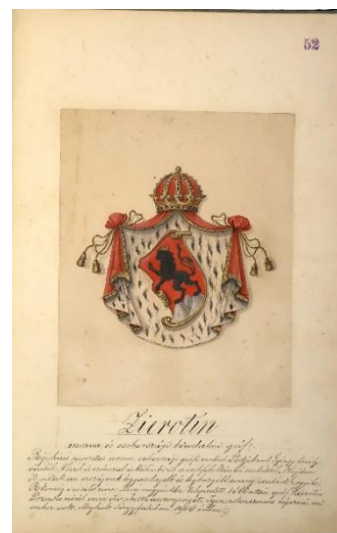
stav po reštaurovaní