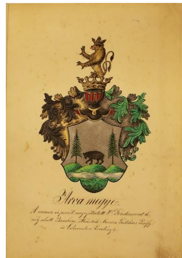
stav pred reštaurovaním