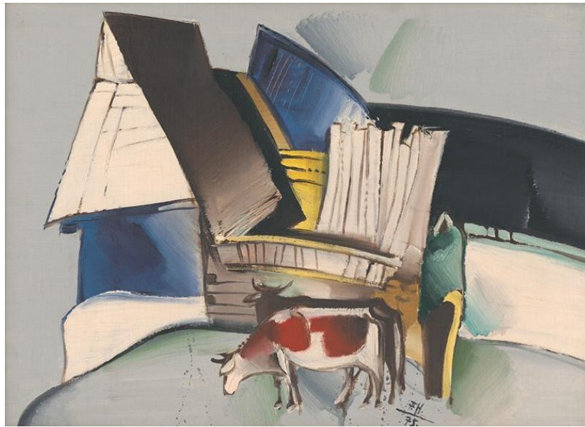
Ferdinand Hložník: Gazda II, 1973, olej, plátno, 49 x 31 cm, OG – O – 396