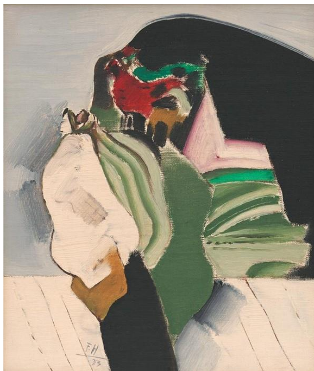
Ferdinand Hložník: Svitanie, 1973, olej, plátno na sololite, 37 x 31 cm, OG – O – 393